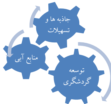
شکل ۲: نقش منابع آبی از طریق جاذبه طبیعی در توسعه گردشگری

عوامل توسعه گردشگری مختلف است، عوامل مهم آن عبارت از جاذبه‌های گردشگری و تسهیلات گردشگری می باشد. جاذبه‌های گردشگری به جاذبه های طبیعی و فرهنگی تقسیم گردیده است. نقش منابع آبی در ایجاد جاذبه های طبیعی فوق العاده می‌باشد. همچنان نقش منابع آبی در مساعد ساختن خدمات و تسهیلات گردشگری که عامل مهم گردشگری است نیز ارزنده است.